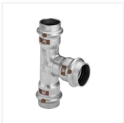
Temponox-Té avec SC-Contur modèle 1718 article 810 139