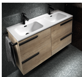
Modèles 4 tiroirs + plan double vasque