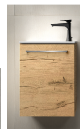
Meuble lave-mains L 40 x H 52 x P 24 cm