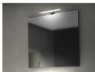
Miroir H 70 cm, chants en finition chromé, avec applique LED. Attaches réglables. Largeur 60, 70, 80, 90 et 120 cm