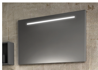
Miroir H 70 cm avec éclairage LED intégré. Attaches réglables. Largeur 60, 70, 80, 90 et 120 cm