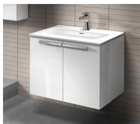
Modèles à 2 ou 4 portes + plan vasque

Dimensions H 52 x P 45 cm avec plan vasque céramique blanc P 46. Mélaminé hydrofuge ép. 18 mm Largeur 60, 70, 80, 90 et 120 cm (120 disponibles en simple et double vasque)* Les poignées des meubles sont à commander séparément.