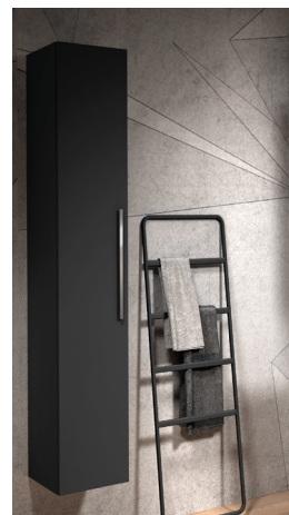
Colonne H 160 x L 35 x P 37 cm, 4 étagères en verre