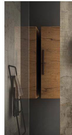
Demi-colonne H 116 x L 35 x P 37 cm, 4 étagères en verre