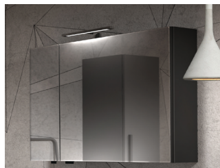
Armoire de toilette H 70 x P 16 cm, portes miroir asymétriques, côtés assortis au meuble. 2 étagères en verre et prise électrique à l'intérieur. Largeur 60, 70, 80, 90 cm