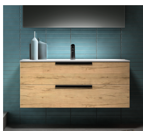
Modèles à 2 tiroirs + plan simple vasque