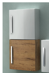
Meuble haut à porte H 35 x L 35 x P 18 cm