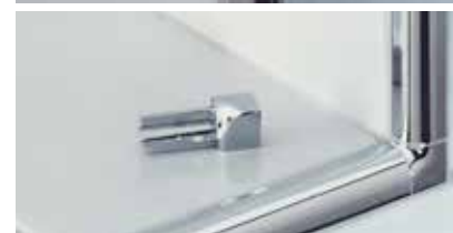
Schlüter®-RONDEC Angle sortant ou rentrant