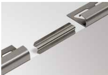
Schlüter®-RONDEC-EV Pièce de liaison pour profilés en acier inoxydable