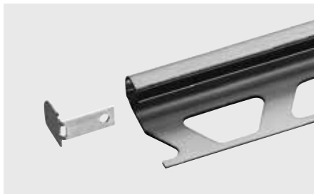
Schlüter®-RONDEC-EB/EK Capuchon de fermeture en acier inoxydable brossé pour RONDEC-E et -EB