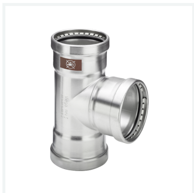
Temponox XL-Té avec SC-Contur modèle 1718XL article 810 757